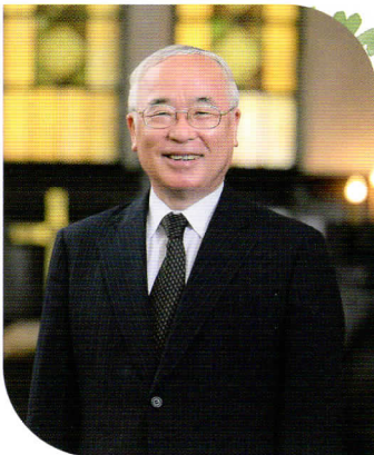
日本基督教団出版局理事長 前日本基督教団総会議長